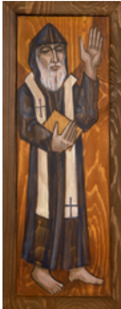
Charbel Makhlouf (1828–1898)