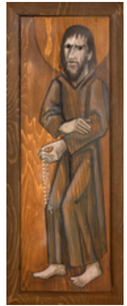
Nicolas de Flue (1417-1487)