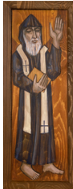
Charbel Makhlouf (1828–1898)